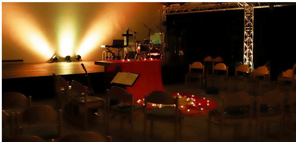
Einblick in die Sonntagsandacht der Jugendkirche

Dazu bereits jetzt eine herzliche Einladung!