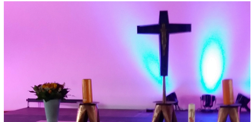
Einblick in die Sonntagsandacht der Jugendkirche