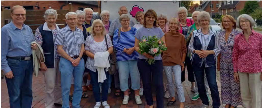
Zum 20. Jubiläum lud die Kantorei ihre Leiterin zum gemeinsamen Eisessen ein.