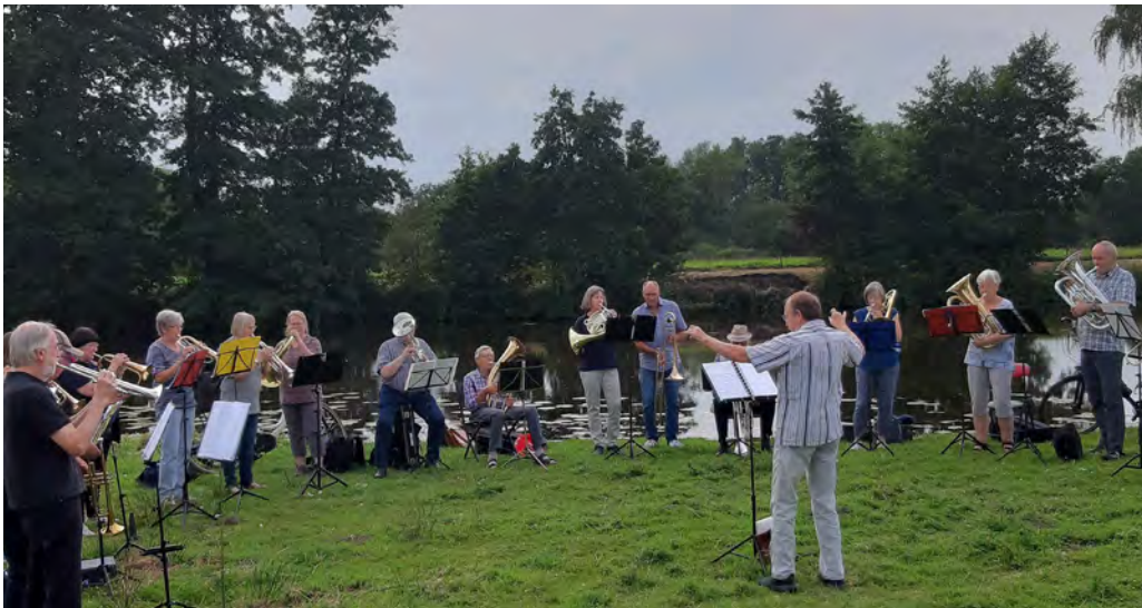
Der Bläserkreis an der „Finkenbrake“ im August 2024

Gottesdienste, Landschaftsandachten, Christliche Feiertage aber auch Ehejubiläen und Bläserensätze zu hohen Geburtstagen sind nur Beispiele für unsere Aktivitäten. Im Jahresrückblick 2023 steht dann: „Wir haben uns also im letzten Jahr 95 mal zum Musikmachen getroffen.“ Was eine Zahl! Und so soll und so wird es weitergehen. Manchem fällt die