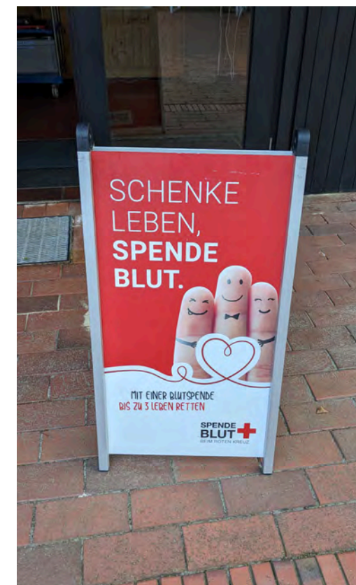
Blutspendeaktion: "Werbung für einen guten Zweck am Kapelleneingang"