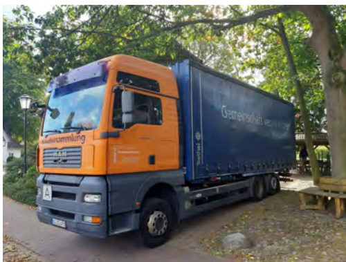
Jahr für Jahr geben so viele Menschen gut erhaltene Kleiderspenden, dass die Säcke und Kartons mit einem großen LKW aus Bielefeld abgeholt werden... - Danke!

Die Spenden werden in den Werkstätten der „von Bodelschwingschen Stiftungen“ für Nutzung, Verkauf und Verwertung sortiert. Kleiderspenden für Bethel: Seriös und sinnvoll.