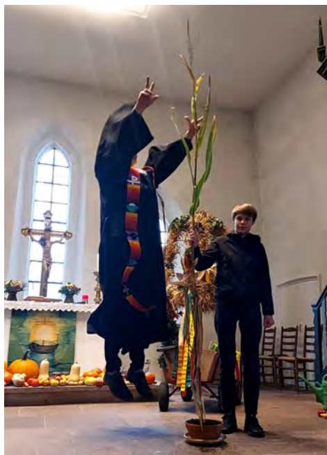
...da kann der Pastor noch so hoch springen – der Mais ist mal wieder größer gewachsen. Danke!!