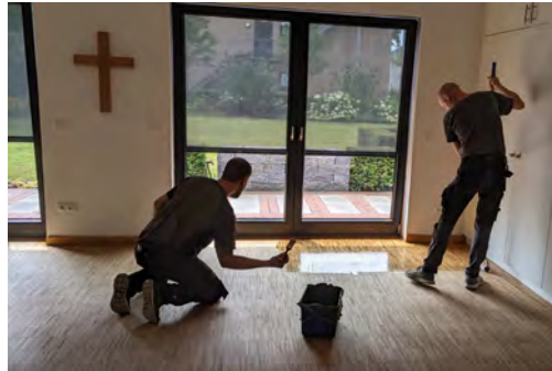
Parkettpflege zu zweit