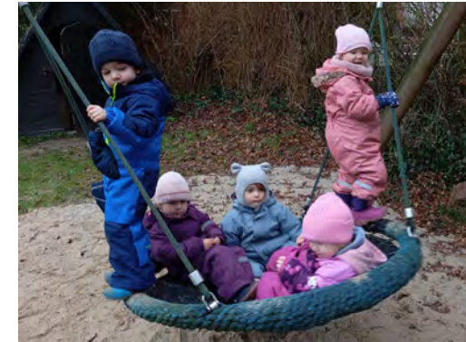
Auch im Winter sind die Spielkreiskinder gerne draußen und nutzen gemeinsam die große Nestschaukel