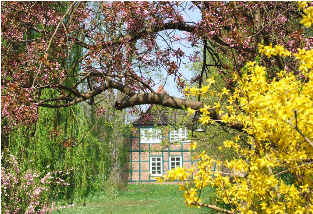
Frühlingsblühen am Hasberger Gemeindehaus

Es geht in ganz unterschiedlicher Form um das innerste Geheimnis unseres Glaubens: Um Leid und Tod, sowie dessen Überwindung durch Gott, um Erlösung und Neuschöpfung. Das ist ein manchmal nicht ganz einfacher Weg. In der Kirchengemeinde möchten wir diesen