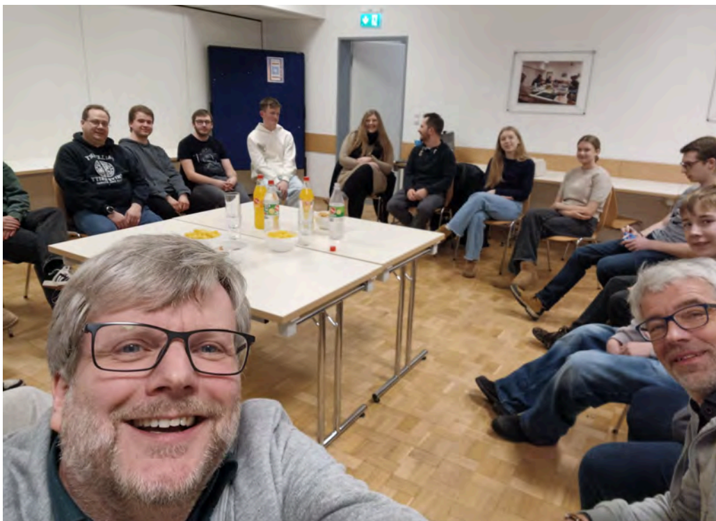
Unser tolles Team beim ersten Planungstreffen in der Jugendkirche